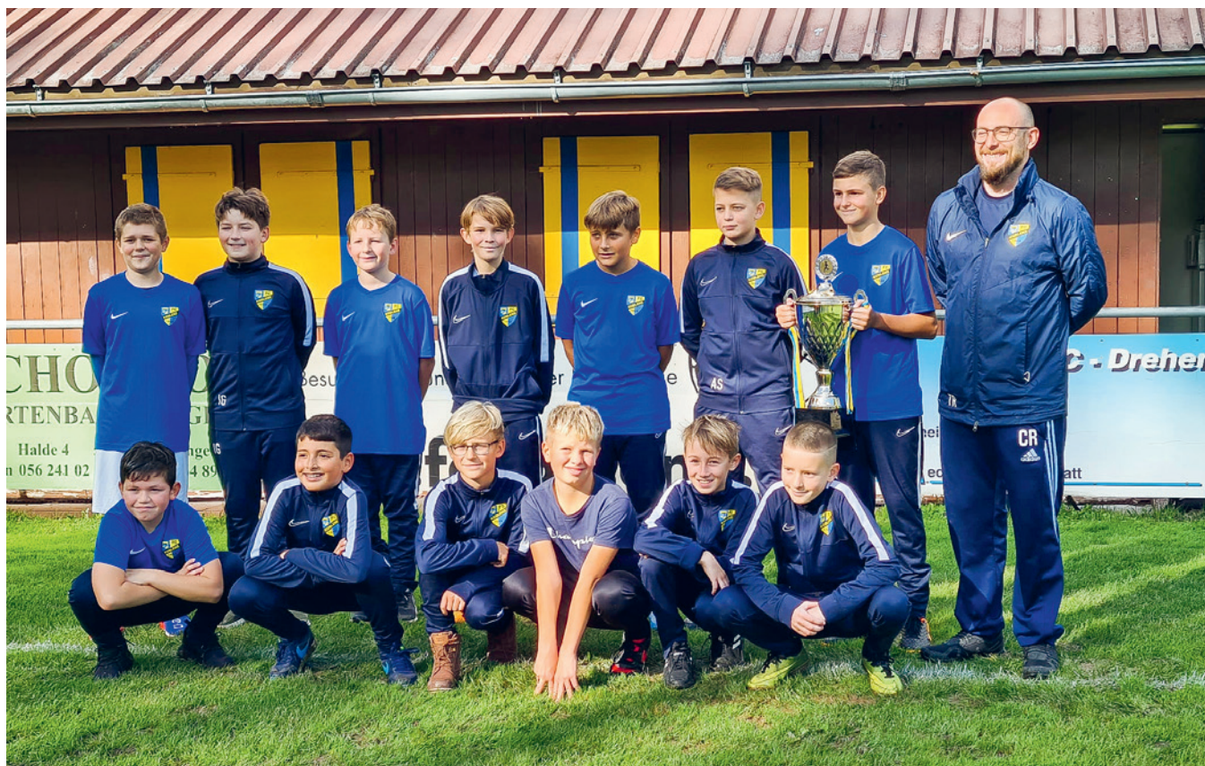
Junioren D FC Koblenz