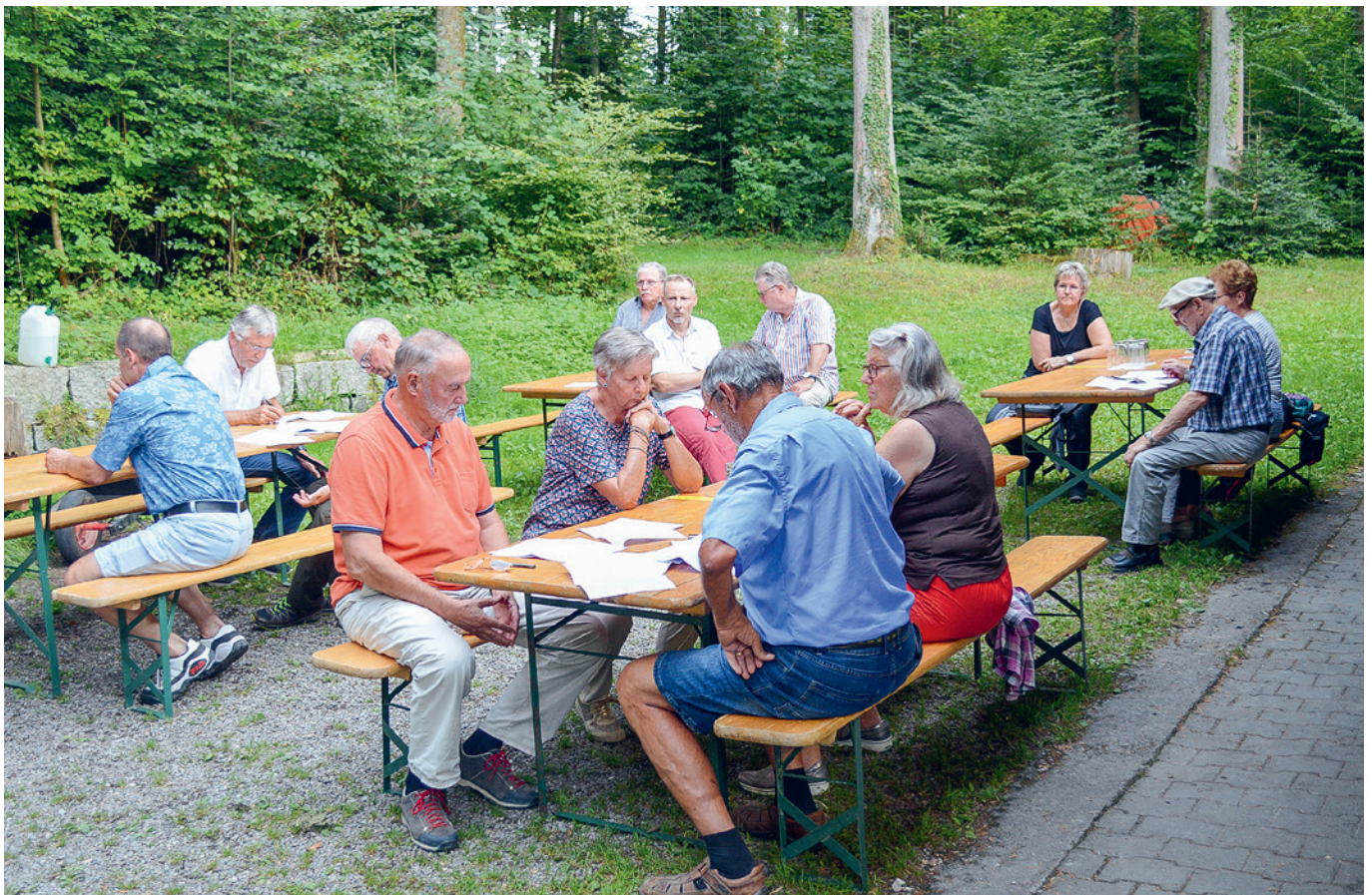
Die Ortsbürger interessieren sich intensiv für die Themen der Ortsbürgergemeindeversammlung

Der zügige Verlauf der Versammlung war eines der Merkmale des Abends. Ein weiteres war die gute Beteiligung, welche es erlaubte, die Beschlüsse definitiv zu fassen. Und last but not least: Auch diesmal fand die Versammlung im zweiten Teil ihre würdige Fortsetzung. Erneut hat die Ortsbürgerkommission es sich nicht nehmen lassen, die Anwesenden mit Grilliertem und einem feinen Dessert zu verwöhnen. Vielen Dank dafür! Es dürfte deshalb nicht verwundern, dass der zweite Teil des Abends mit diesem Genuss mehr Zeit beanspruchte als die vorherigen Verhandlungen.