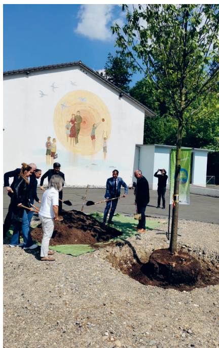
Prominente pflanzen die Edelkastanie in der Koblenzer Klimaoase.

Entscheidet sich eine Gemeinde für die Teilnahme an der Aktion, pflanzt sie einen Baum als künftige Klimaoase vor Ort. Die Aktion Klimaoase berät dabei die Gemeinde mit Fachpersonen bei den Themen wie Standortwahl, Baumgrube, Wahl der richtigen