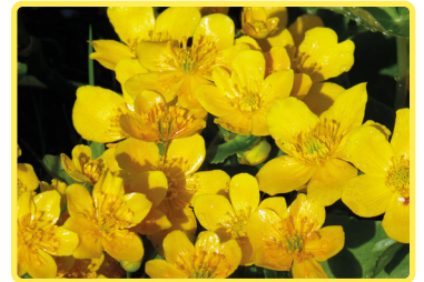
Die wichtigsten Blütenteile sind schön zu erkennen: Narbe, Fruchtknoten, Staub- und Kehlblätter.

Ist Koblenz also dotterblumenlos? Nicht ganz! Es gibt Hoffnung. Ähnlich wie im Gallier-Dorf der Widerspenstigen bei Asterix, gibt es Orte, die sich weigern, ihren geliebten gelben Schmuck einfach herzugeben. So ist es für uns weiterhin möglich, sich an der Blütenpracht zu erfreuen, bevor sie ganz verschwindet. Das besonders, wenn man bedenkt, dass schon die Römer und die alten Russen diese Pflanze nicht nur ihrer Schönheit wegen geschätzt hatten. Die Ersten nutzten sie gegen Menstruationsstörungen, derweil man sie jenseits des Urals harntreibend benötigte.