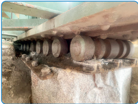
So sah das Originallager von 1859...

Der geschichtsträchtige Viadukt ist die älteste Eisenbahnbrücke zwischen der Schweiz und Deutschland.