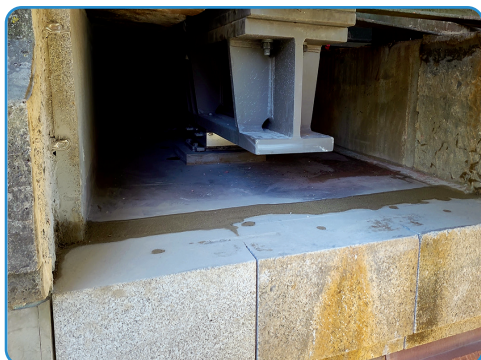
...und so sieht das sanierte neue Lager aus.