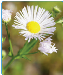
Blütenkörbchen 1-2 cm breit, viele schmale Zungenblüten in weiss bis lila, blüht von Mai bis Oktober