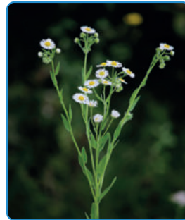
Behaarte Stängel, oben verzweigt, bis 1,5 m hoch