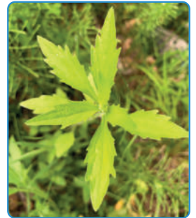
Hellgrüne behaarte Blätter, am Rand grob gezähnt