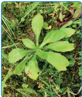
Überwinterung als Rosette